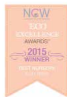
POND USA 2015