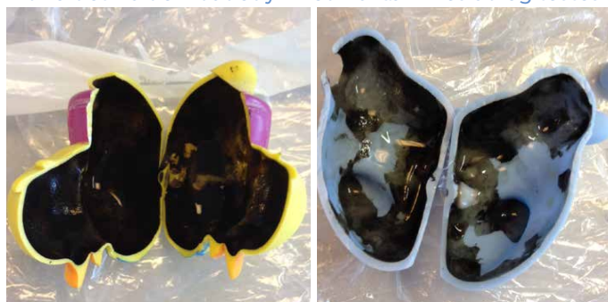
Det grumme syn af belægningerne indvendigt i dyrene.