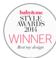
KAWAN UK 2014