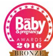
KAWAN MINI UK 2016